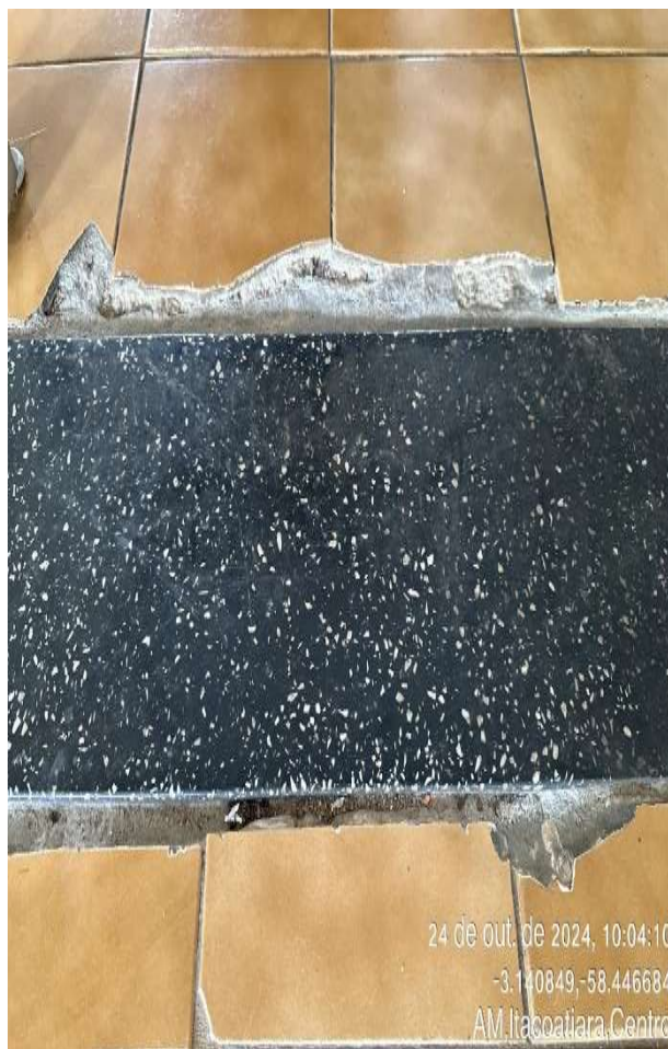
Piso cerâmico danificado

24 de out. de 2024, 10:04:10 -3.140849,-58.446684 AM, Itacoatiara, Centro