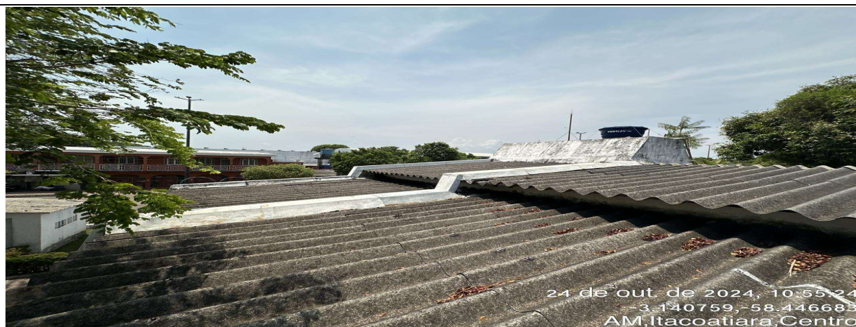
Rufo com oxidação e danificado