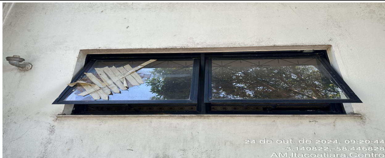
Telhado de fibrocimento