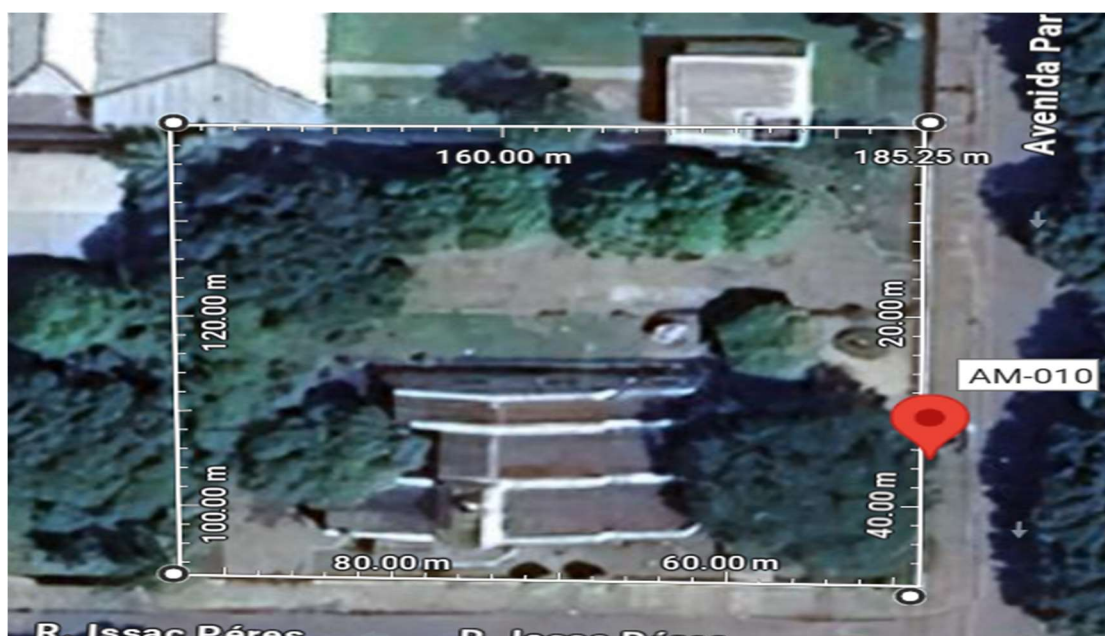
Figura 01 – Ilustração da demarcação do terreno da AG/Itacoatiara-AM.

A área constituinte da Agência da Receita Federal do Brasil em Itacoatiara-AM, compõem um imóvel onde está localizada as dependências administrativas, sendo o terreno com formato regular com área, aproximadamente, de 2.168,95 m².