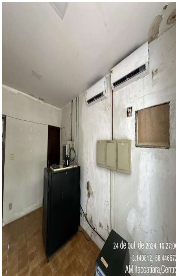
Sala do CPD com infiltrações e mofo

24 de out. de 2024, 10:27:06 -3.140812,-58.446672 AM, Itacoatiara, Centro