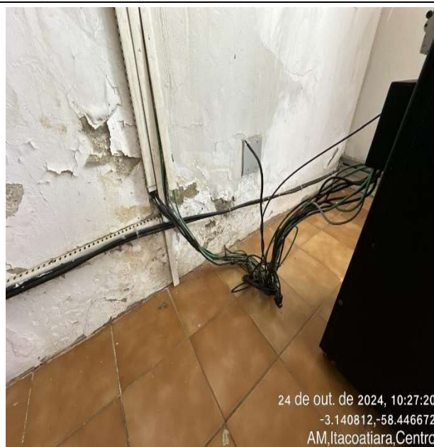
Sala do CPD com infiltrações e mofo