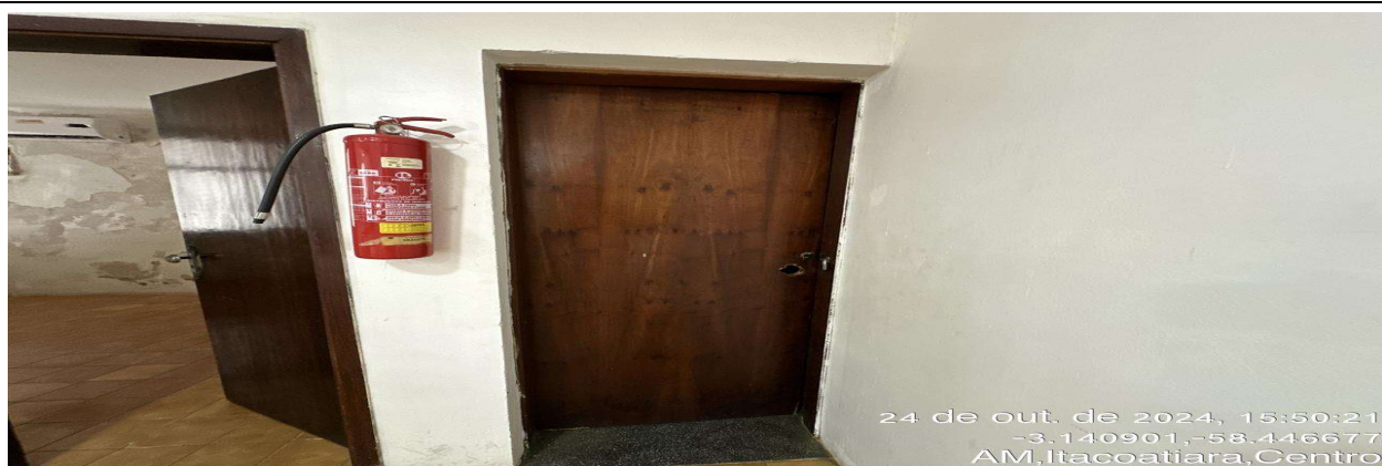
Vidro da esquadria quebrado