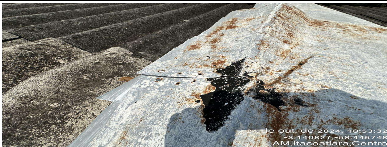
Área de Atendimento